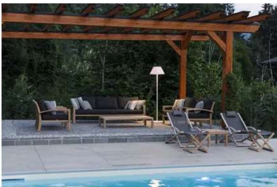
Zona Lounge outdoor

«Le scelte stilistiche in termini di interior design, con finiture preziose, arredi ricercati e i toni caldi , hanno permesso la realizzazione di zone giorno accoglienti, con ampi spazi di convivialità, in contrasto con quelli più intimi e riservati dell'area notte. Dal piano terra che apre sull'outdoor, ogni singolo dettaglio proposto da CLM Design & Contract ha saputo interpretare la nostra